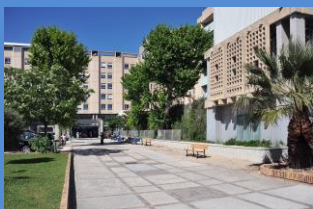
Unité d'Accueil et de Soins pour les Sourds Langue des Signes Consultations de médecine générale Consultations spécialistes avec interprète LSF